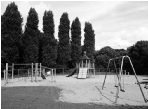
Speelplek Rode kruis Plantsoen

In ons julinummer berichtten we u over de plannen voor de herinrichting van de speeltuin aan de Laan van Poot aan de noordkant van de Montessorischool. Eind september of begin oktober zullen de werkzaamheden hier beginnen en in november zal de nieuwe speelplek klaar zijn voor gebruik.