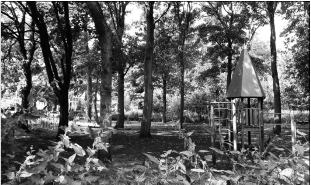
Speelplek aan de Laan van Poot bij de IVIO-school